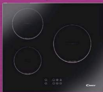
TABLE DE CUISSON À INDUCTION CANDY